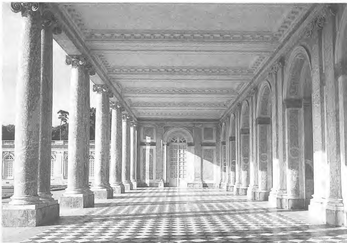
Peristilo del Gran Trianón de Versalles (por Jules Hardouin Mansart, 1670)

unidad de la fe como una auténtica necesidad de Estado , considerando anormal y peligrosa la existencia de súbditos que profesaran una religión diferente a la de su príncipe. La administración era consciente de una misma necesidad, y en concreto los intendentes veían con sumo desagrado las fricciones y los conflictos que a nivel local producía el enfrentamiento entre católicos y protestantes. Tales puntos de vista eran compartidos por la iglesia tradicional —que clamaba contra la desgraciada libertad de conciencia —, y, en general, por la inmensa mayoría de las fuerzas católicas, ya se tratara de jesuitas, jansenistas o galicanos. Esta inclinación común de la monarquía, la administración y la Iglesia católica contra los intereses protestantes constituyó un auténtico bloque en la Francia de finales del siglo XVII, prácticamente insorteable, y que condujo a una escalada progresiva de represión contra la religión reformada.